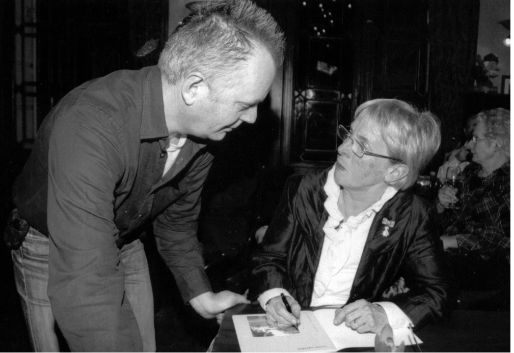
Miets schrijft een speciale boodschap voor de Voorzitter.

In de bekende serie Maastrichter Silhouet, uitgegeven door de Stichting Historische Reeks Maastricht, is het deel Casino Slavante verschenen. Elke uitgave is een feest voor eenieder die geïnteresseerd is in de historie van Maastricht, maar deze uitgave was dit extra omdat het hier om het vijfenzeventigste deel in de reeks gaat.